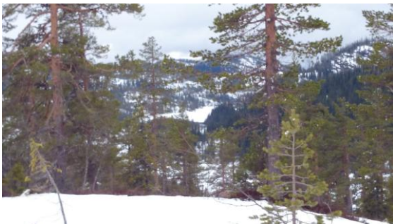
Utsikt fra Stovassåsen.

Generelt kan det sies at selvjustisen er god og oppsynet har god kontakt med løypekjørere som melder fra hvis de ser ureglementert kjøring.