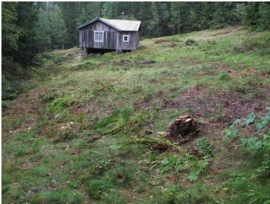
Setervollen ferdig ryddet og slått.

Hvitkurle, en truet orkidé, ble i verneprosessen registrert på setervollen ved Svartetjønn. Det var 3. sesong det ble slått på setervollen i år, og tiltaket foreslås tatt inn i c skjema for 2015.