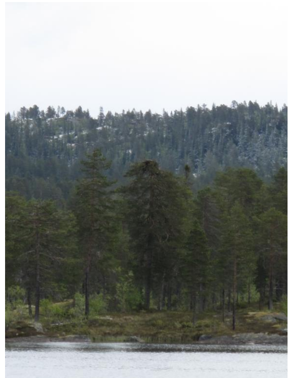
Fiskeørnreir i tilknytning Trillemarka Rollagsfjell NR.

Det har vært noe fokus fra publikum på dette området i år. Det har vært hevdet at det er for mye trafikk rundt reirene i den mest sårbare perioden, og at SNO burde følge dette tettere opp. SNO har i denne sammenheng vist til at det er vellykkede hekkinger hvert år.