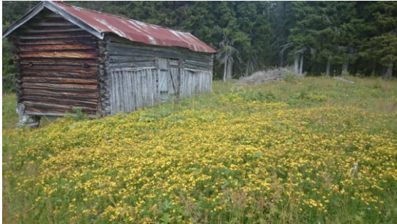
Snårsetra i blomsterprakt.

SNO har ikke avdekket ureglementerte hendelser av betydning inneværende år.