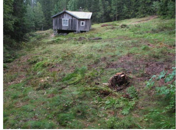
Setervollen ferdig ryddet og slått.