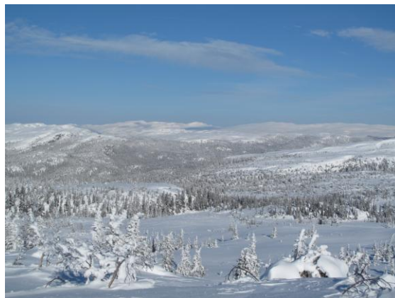
Trilledalen i vinterdrakt.

Generelt kan det sies at selvjustisen er god og oppsynet har god kontakt med løypekjørere som melder fra hvis de ser ureglementert kjøring.