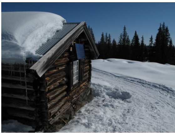
Mesetre ble besøkt på en tilsynsrunde.

SNO har ikke avdekket ureglementerte hendelser av betydning inneværende år.