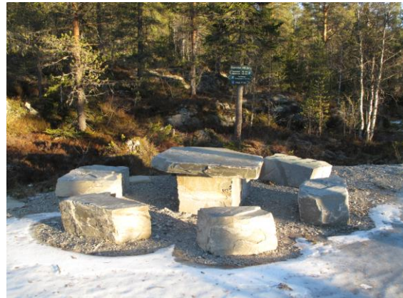
Bord og benk ved Fuglleiken.

Det har i år blitt satt opp 1 bord og benker av samme type stein som bautaene til infotavlene.