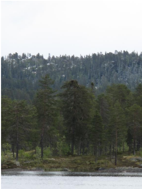
Fiskeørnreir i tilknytning Trillemarka Rollagsfjell NR.

Fiskeørnreiret og fiskeørna ved Buvatn er fulgt opp, og den ser ut til å trives. I tillegg er det registrert 3 reir til i eller tilknytning verneområdet.