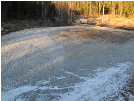
Parkering og snuplass, Bjørndalen.

Etter at tiltaket vedrørende bru over bekken ved Rollagstjønn ikke ble aktuelt, ble tiltaket snuplass og parkering ved Bjørndalen tatt inn.