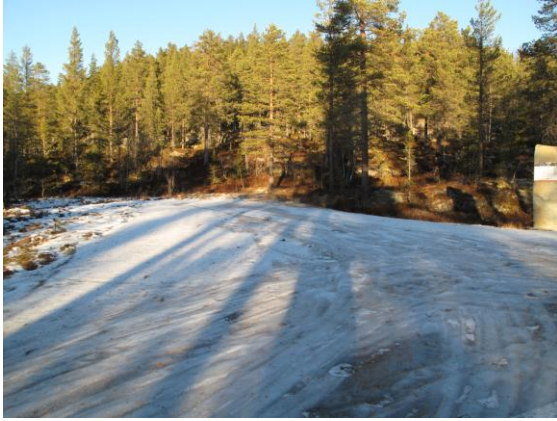
Parkering og snuplass, Fugleiken.