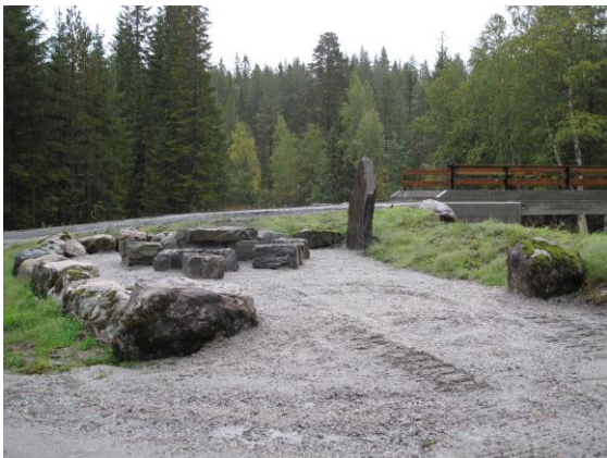
Infopunktet ved Maribråtan.

Sittegruppe ved Maribråtan samt infotavle og sittegruppe ved Skoddølvatn er utført.