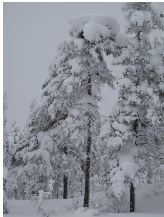
Fiskeørnreir ved Buvatn i vinterdrakt.

Det har også vært en tettere oppfølging av kongeørnreir i regionen denne sesongen, flere vellykkede hekkinger.