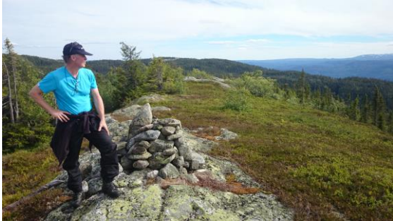
Befaring av sti, Tråenmørkje.

SNO har ikke avdekket ureglementerte hendelser av betydning inneværende år.